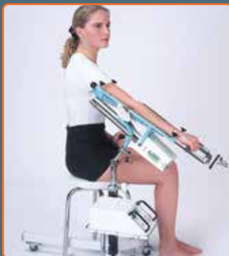
Kinetec 6080 REF.4621000802

Orthoservice Ro+Ten distributeur officiel Kinetec en Suisse