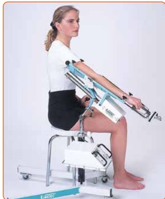
Extension complète: -10°