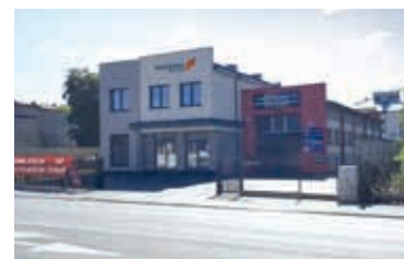
ORTHOSERVICE POLSKA Sp. z o.o. 2021 - Częstochowa, Poland