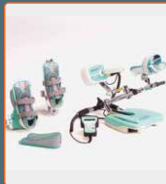
Kinetec BREVA REF.4621006502