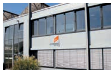
ORTHOSERVICE DEUTSCHLAND GmbH 2011 - Baden-Baden, Germany