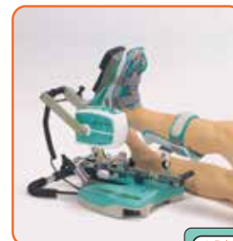
Flexion dorsale 30°