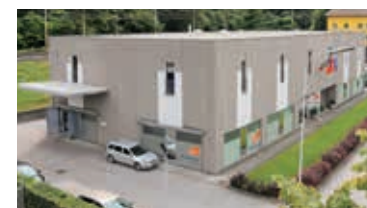
ORTHOSERVICE AG 1996 - Chiasso, Switzerland