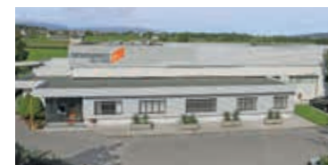
ORTOVENETA 2007 - Maser, Italy