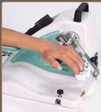
Kinetec MAESTRA REF.4621005002