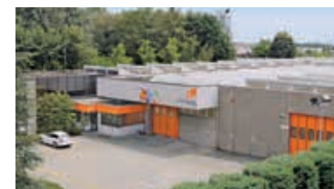
RO+TEN S.r.l. 1978 - Verano Brianza, Italy