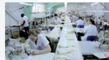
ICS ORTHOSERVICE 2010 - Balti, Moldova